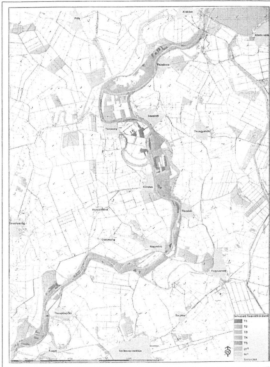
9. ábra. A tervezett beavatkozások közvetlen élővilágvédelmi hatásterülete, az alkalmazni kívánt technológiák területi elkülönítésével. A TP1 technológia által érintett tuskóprizmákat nem tüntettük fel, mert az nem külön erdőrészekben zajlik, hanem a különböző „T” jelű technológiákkal érintett erdőrészekben belül található tuskóprizmák sávjában.

Vélelmezett hatásterület vélelmezett határai: