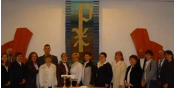
Június 4-én, Pünkösdkor a fegyverneki N i Kar a berekfürdői Református templomban énekelte.