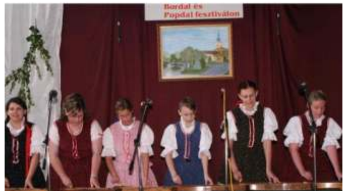
A Pacsirta Citerazenekar