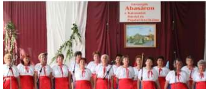
A Szapáry Népdalkör