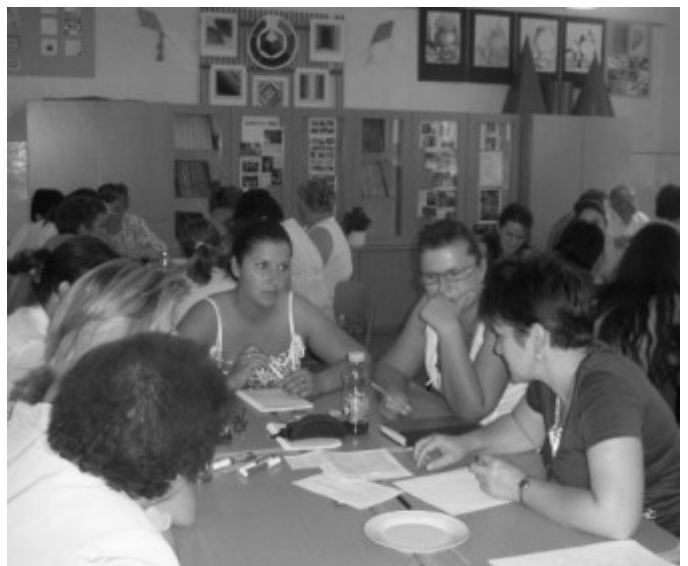
-Nevelési értekezlet a szemléletváltás érdekében-